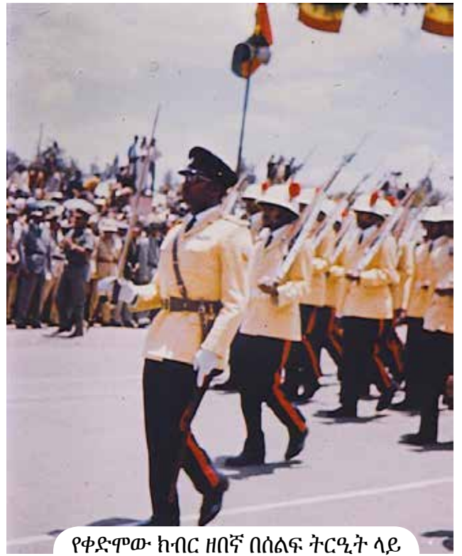
የቀድሞው ከብር ዘበኛ በሰልፍ ትርዒት ላይ