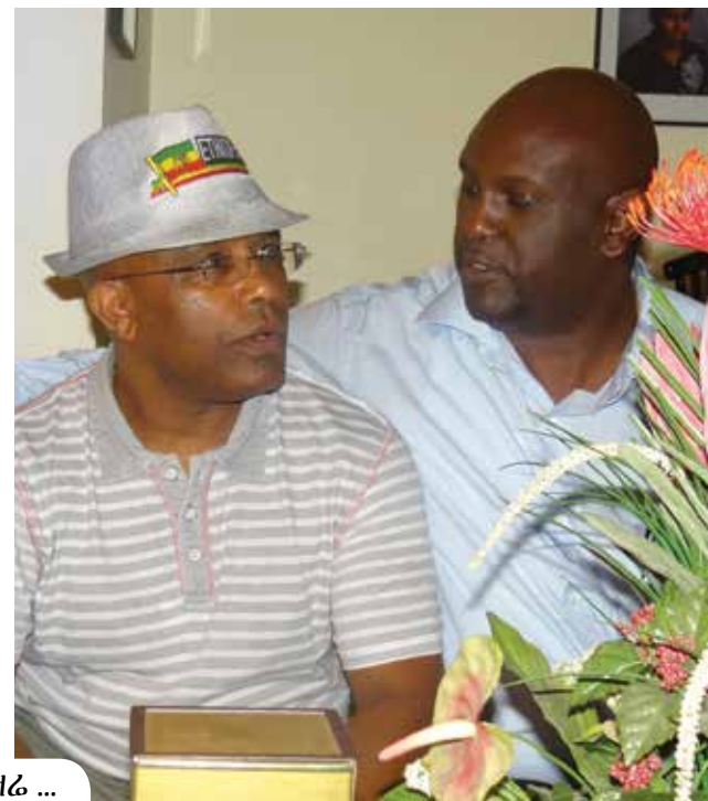
ሁለት ቀቤዎች ፣ የትናንት አፍሮዎች ፣ የዛሬ ...