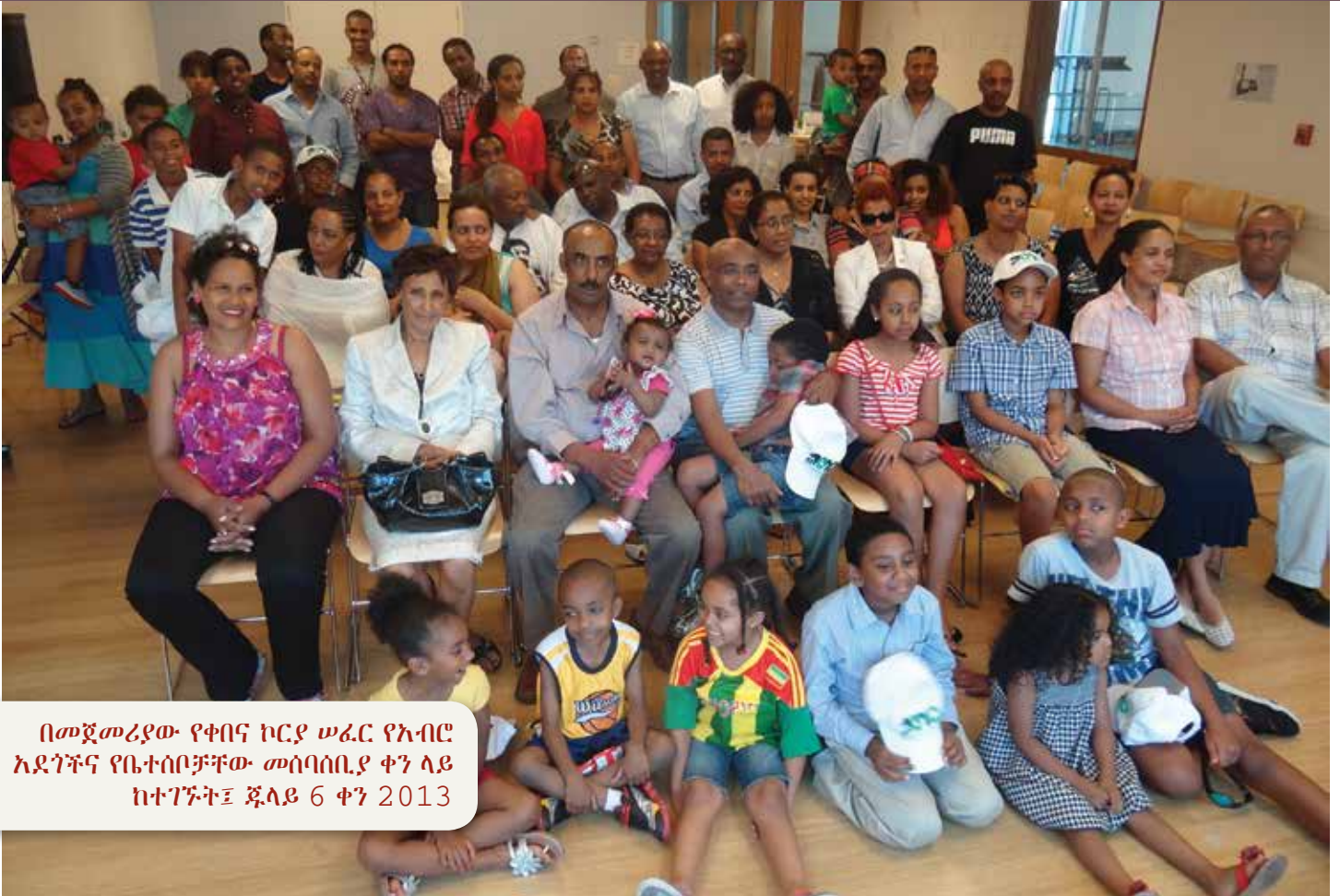
በመጀመሪያው የቀበና ኮርያ ሠፈር የኡብሮ አደጎችና የቤተሰቦቻቸው መሰባሰቢያ ቀን ላይ ከተገኙት፤ ጁላይ 6 ቀን 2013

መግቢያው ላይ እንደተጠቀሰው የሳሙኤል የጉብኝት እና የግርማ ጥረት ፍሬ አፍርቶ፣ ሁላችንንም ቀስቅሶ የምንገናኝበትን ጊዜ ለማቅረብ ጥረት ስናደርግ ከረምን። እኔም አዳሬም ውሎም ቀበና ሀኪም ሜዳ ሆነ- በሃሳብ። የእኔነቴ መገለጫ ቀበና፣ ያ የልጅነት ጊዜ እንደ ህልም እየሆነ ዝምታ እና ትካዜ ሆነ ስራዬ። አብሮ አደጎቼን የማግኘትና በአይን የማየት ፍላጎቴ እየጨመረ መጣ። የምንገናኝበትን ቦታና ቀን ከተወሰነ በኋላ እኛም በግላችን ዝግጅታችንን ቀጠልን። ከዋናው ፕሮግራም ከሁለት ቀን በፊት በሆቴላችን ውስጥ የመጀመሪያውን ግንኙነት እንድናደርግና እራት እንድንበላ ለኮሚቴው ጥሪ አደረግን። ያቺ ታሪካዊ ምሽት ከዋናው ግንኙነታችን በፊት እንድታለማምደን አስበን ነበር ያደረግናት።