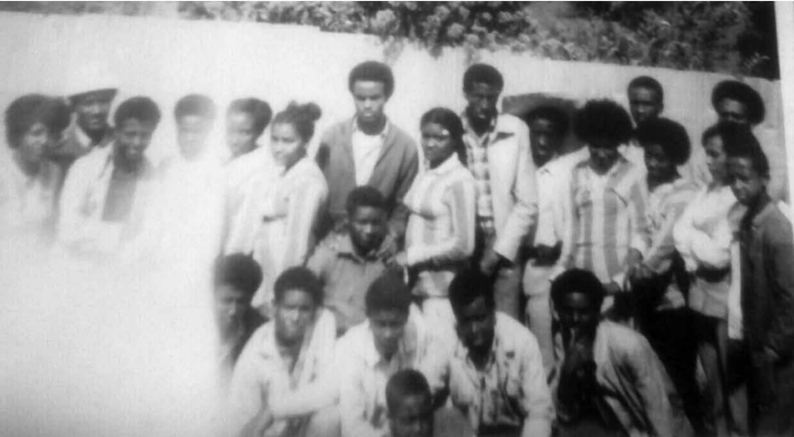
ስንት ሰው ያውቃሉ እዚህ ፎቶ ውስጥ . . . ?