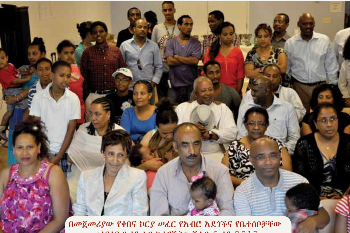
በመጀመሪያው የቀበና ኮርያ ሠፈር የአብሮ አደጎችና የቤተሰቦቻቸው መሰባሰቢያ ቀን ላይ ከተገኙት፤ ጁላይ 6 ቀን 2013

ይህን ቤተሰብ የተቀላቀሉት ሁሉ እንደ አንድ ሰው ሆነው፣ ተከባብረው፣ ተባብረውና ተሰማምተው ዘለቁ፤ ጉዳያቸው የእዝዚአብሔር ፈቃድ የተጨመረበት ስለነበረም ሃሳባቸውን ለመፈጸም በቁ። ክብሩ ይሰፋና።