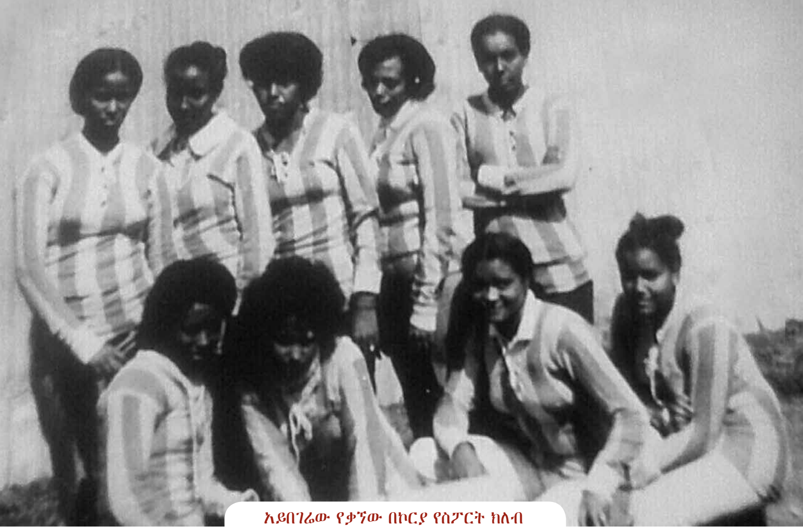
አዩባገሬው የቃኘው በኮርያ የስፖርት ክለብ