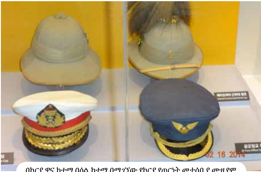
በኮርያ ዋና ከተማ በሶል ከተማ በሚገኘው የኮርያ የጦርነት መታሰቢያ ሙዚየም (War Memorial) ውስጥ የሚታዩ በኮርያ ጦርነት የተሳተፉት የኢትዮጵያ ሰራዊት አባላት ለብሰዋቸው የነበሩ ወታደራዊ መለዮዎች