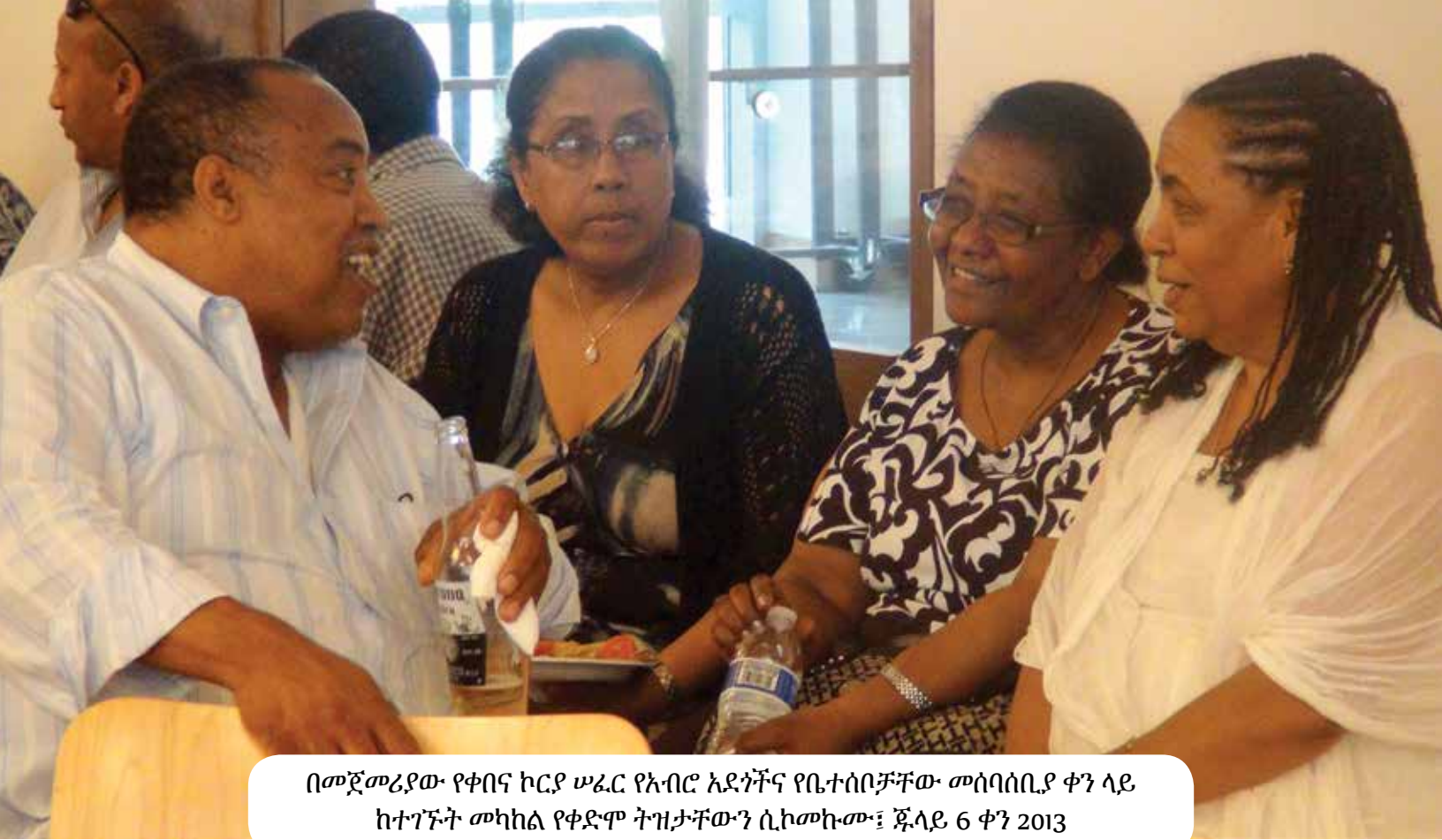
በመጀመሪያው የቀበና ኮርያ ሠፈር የአብሮ አደጎችና የቤተሰቦቻቸው መሰባሰቢያ ቀን ላይ ከተገኙት መካከል የቀድሞ ትዝታቸውን ሲከመኩሙ፤ ጁላይ 6 ቀን 2013