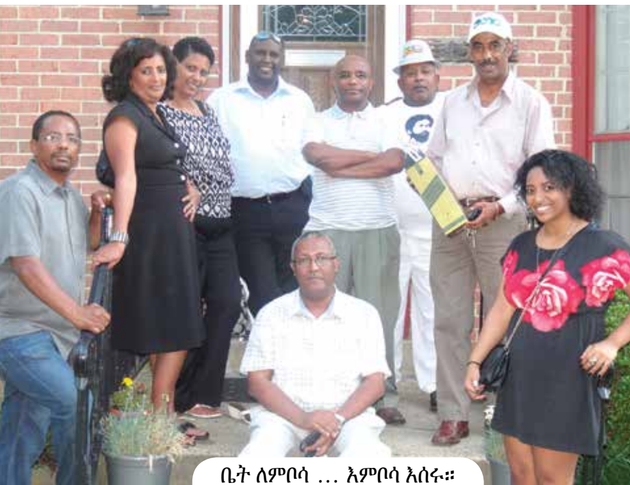
ቤት ለምሳሌ ... እምሳሌ እሰሩ።