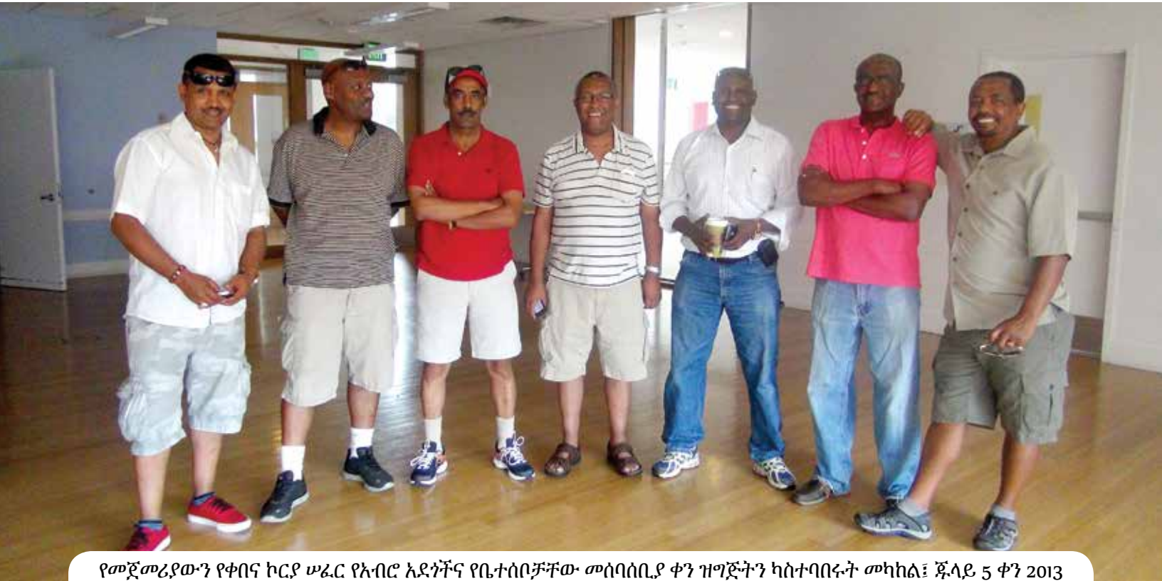
የመጀመሪያውን የቀበና ኮርያ ሠፈር የአብሮ አደጎችና የቤተሰቦቻቸው መሰባሰቢያ ቀን ዝግጅትን ካስተባባሩት መካከል፤ ጁላይ 5 ቀን 2013