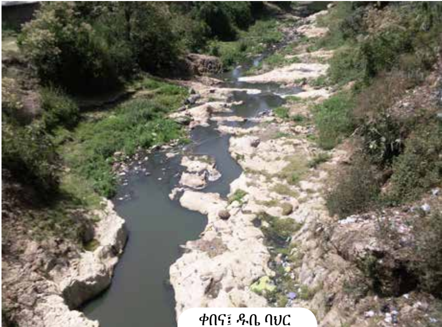
ቀበና፤ ዱቤ ባህር